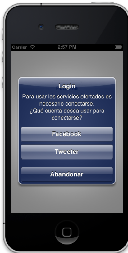
iOS 7 Action Sheet