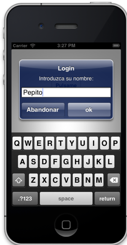
iOS 7 Alert Views