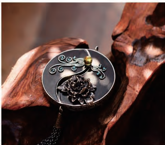
-Título:Jiangnan Fu- Fénix y Peonía 作品名称: 江南赋—丹贵镂衣 -Fecha: 2014 作品创作年代: 2014年 -Técnica o tipo:Joya de metal 技法或作品类型: 金工首饰