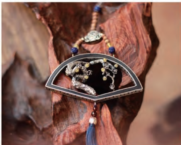
-Título:Jiangnan Fu- Ciruelo en invierno 作品名称: 江南赋—雪夜冬梅 -Fecha:2014 作品创作年代: 2014年 -Técnica o tipo:Joya de metal 技法或作品类型: 金工首饰